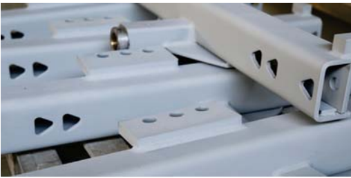
Front Axle W/Pivot Bushing Hidrolik Ön Dingil