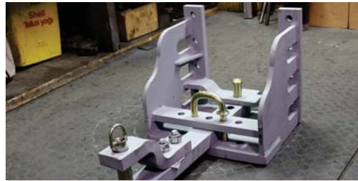
Rear Tow Hook Sabit Arka Çeki