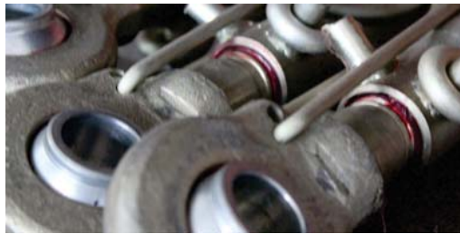
Top Link Assembly Hidrolik Orta Kol