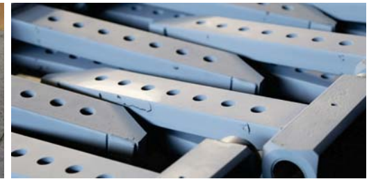
Front Spindle Arm Hidrolik Dingil Başı