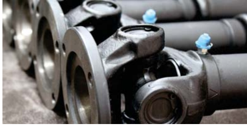
Cardan Shaft Kardan Mili