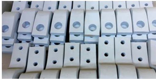
DrawBar Çeki Oku