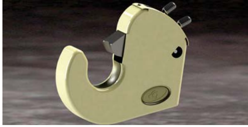
Lift Arm Hook Kaldırma Kolu Kancası