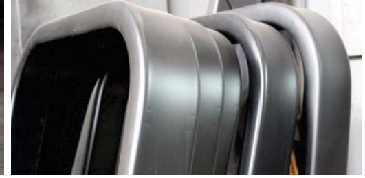
Rops Emniyet Çemberi