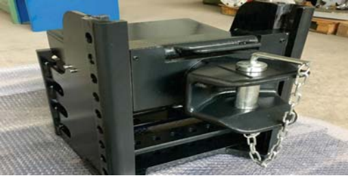
Height Adjustable Rear Tow Hook Asansörlü Arka Çeki